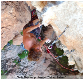
Chris Sharma probando "Chilam Balam"

Tras encadenar la vía, Chris Sharma decidió dedicar su tiempo a otras tareas mundiales de la escalada.