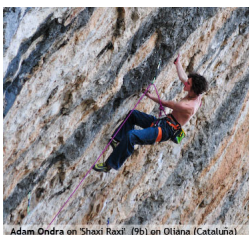
Adam Ondra on Shari Raxol (9b) en Oliena (Cataluña)

En Abril del 2011 llegó a España. Empezó a bajar desde norte hacia el suroeste.